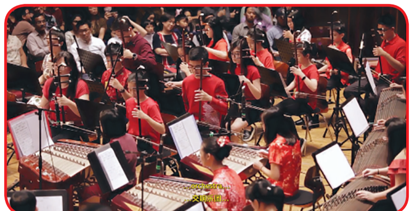
Siswa Bina Bangsa School belajar musik Tionghoa.