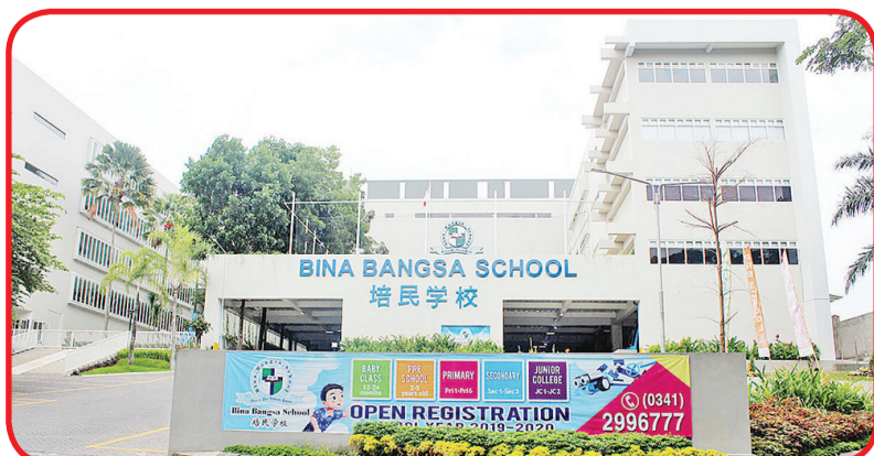
Gedung Sekolah Bina Bangsa School Malang.

Sementara siswa Taiwan memperkenalkan sup daging sapi, tiram goreng, biskuit tiram goreng dan mangga kering di Yujing. • idn/din