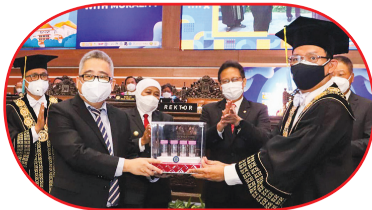
Menkes Budi Gunadi Sadikin (keempat dari kiri) dan Gubernur Jatim Khofifah Indar Parawansa (ketiga dari kiri), saat menyaksikan penyerahan seed vaksin dari Rektor Unair ke PT. Biotis Pharmaceuticals Indonesia.