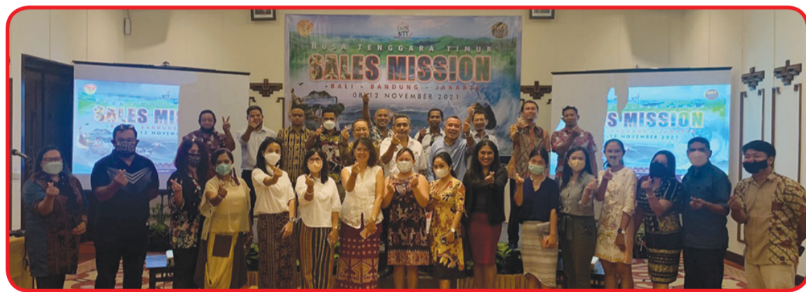
Wartawan berfoto bersama staf Nusa Tenggara Timur Sales Mission.

Selain penyelenggaraan Nusa Tenggara Timur Sales Mission di Bali, kegiatan serupa juga diselenggarakan di Crowne Plaza Hotel Bandung Senin (8/11) dan akan berakhir Jumat (12/11) dan akan datang di Hotel Borobudur Jakarta. • yelu/din