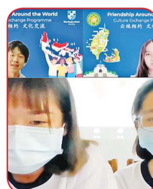
Perwakilan siswa kedua sekolah menyampaikan pidato.