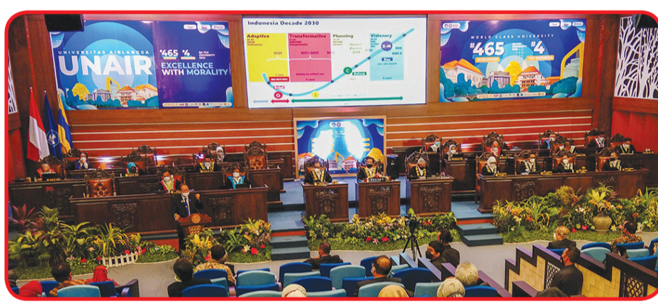
Suasana sidang senat Dies Natalis Unair ke-67.

"Saya berdoa mudah-mudahan lancar. Sehingga pada semester kedua tahun depan, Vaksin Merah Putih telah bisa diproduksi. Hal ini juga sangat bergantung pada bantuan dari Ibu Gubernur Jawa Timur Khofifah Indar Parawansa. Karena rencananya akan dilakukan di Surabaya," ujarnya lagi.