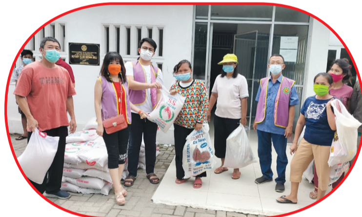
A Ni secara simbolis menyerahkan paket sembako kepada warga.