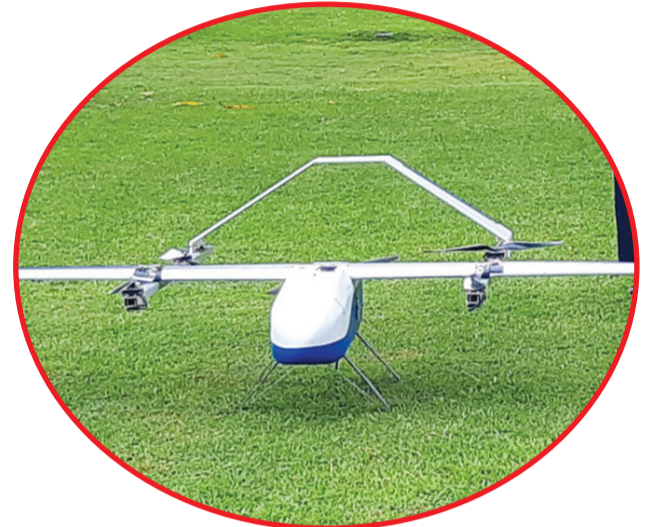
Model drone untuk pengiriman logistik medis ketika diuji coba pada perhelatan HUT Kabupaten Sumenep ke-752.

SUMENEP (IM) - ITS (Institut Teknologi Sepuluh Nopember) bersama DUDI (Dunia Usaha dan Dunia Industri), yakni Beehive Drones dan Tinc (Telkomsel Innovation Center), menciptakan pesawat tanpa awak (drone) untuk pengiriman kebutuhan medis antarpulau dan daerah terpencil di Kabupaten Sumenep.