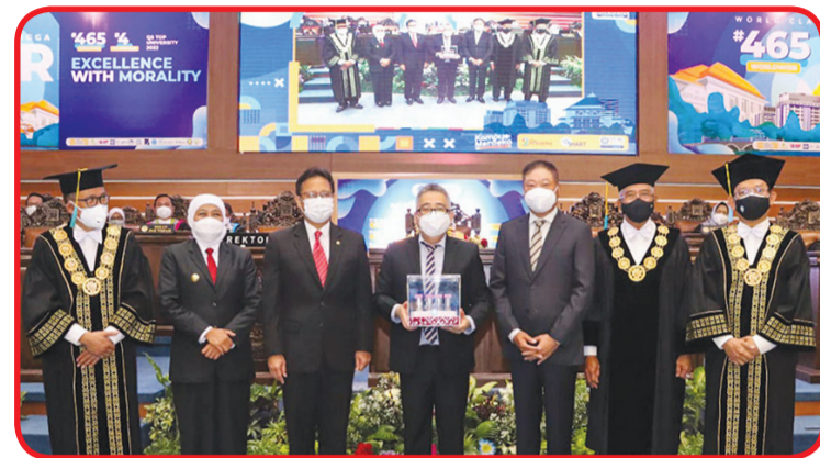
Foto bersama usai penyerahan seed Vaksin Merah Putih.

SURABAYA (IM) - Menteri Kesehatan Budi Gunadi Sadikin, menyatakan dukungannya terhadap pengembangan Vaksin Merah Putih buatan Unair (Universitas Airlangga).