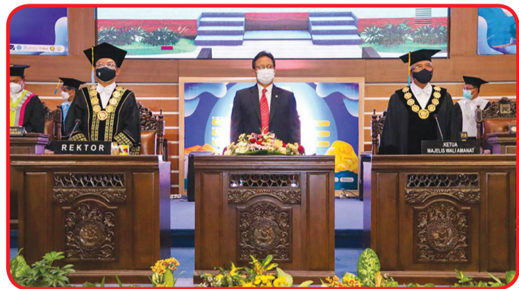
Menkes Budi Gunadi Sadikin (tengah) bersama pimpinan Unair saat menjadi keynote speaker Dies Natalis Unair ke-67