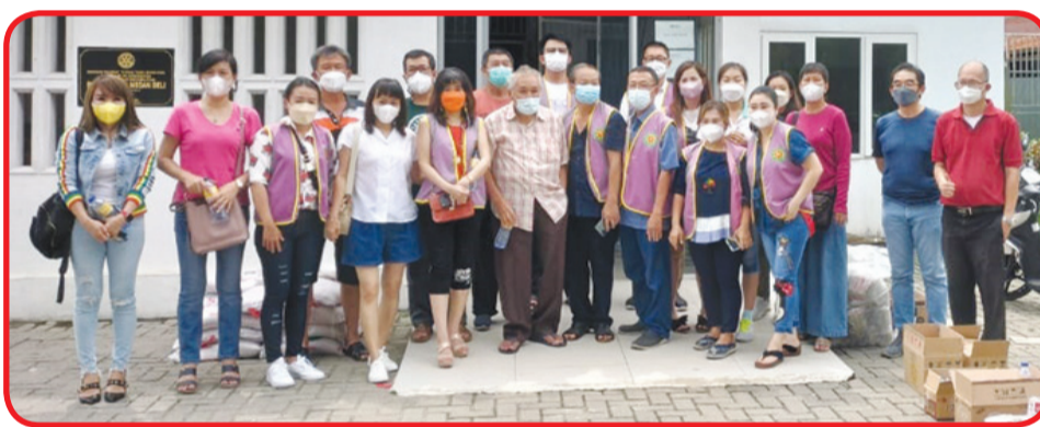
Pengurus Kelompok Anathapindika Medan berfoto bersama.

terdiri dari pasta gigi, sikat gigi, sarden, teh, minyak goreng, gula pasir, susu kental manis, sabun mandi, deterjen, kecap, bihun, ifu mie, beras dan lainnya sebanyak 100 buah.