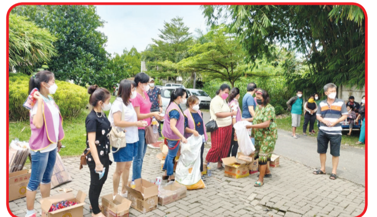
Warga mengantri dengan menjaga jarak untuk menerima paket sembako.